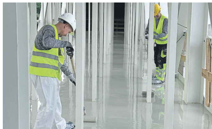
Chemikalienresistente Böden in Halbleiterfabrik