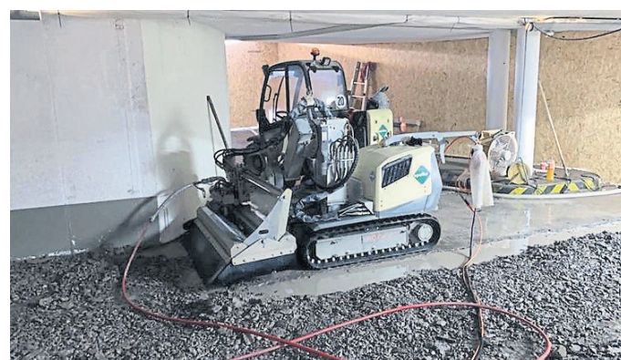
Betoninstandsetzung mit Robotertechnik